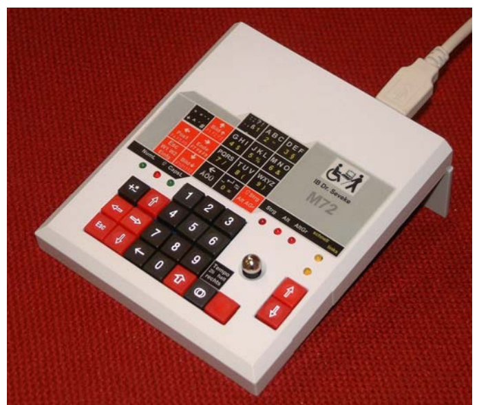
M72 mit Microjoystick

Tastatur & Maus werden über USB mit dem PC verbunden.